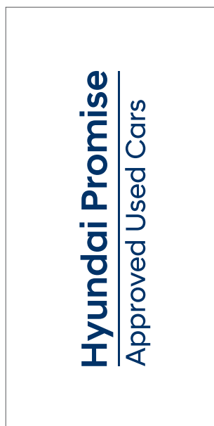
Rysunek 1 Grafika strona A